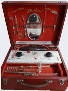
Malette portative de « Rayons curatifs ultraviolets » des années 30